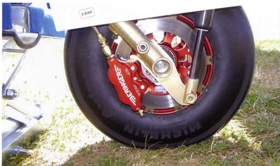
Das große, leichte 5-Zoll-Beringer-Rad ist mit einer hervorragend wirksamen hydraulischen Scheibenbremse ausgestattet

Schon beim Transport zum Start erweist es sich als hilfreich: Ein Flügelrad aufgesteckt, Seil ans Auto, ich setze mich ins Cockpit und Ola zieht mich über den Platz, wobei ich die Steuerbarkeit als hervorragend empfinde und mit der wirksamen, über den Bremsklappenhebel sauber dosierbaren hydraulischen Scheibenbremse ein „Aufrollen“ sicher vermeiden kann. Auch im Start gibt es Sicherheit: Dank der hohen Spornlast führt es einwandfrei. In Zusammenarbeit mit den in den kleinen unteren „Winglet-