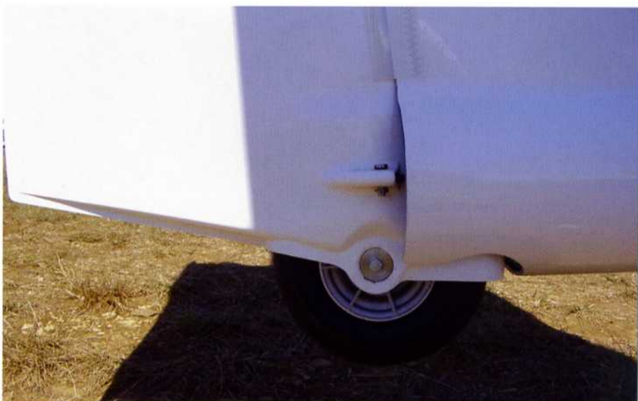
Das Spornrad ist lenkbar und in das Seitenruder integriert

Die Federtrimmung verstellt sich nach Entriegeln nicht selbstständig, der griffig liegende Anzeigeknopf auf der linken