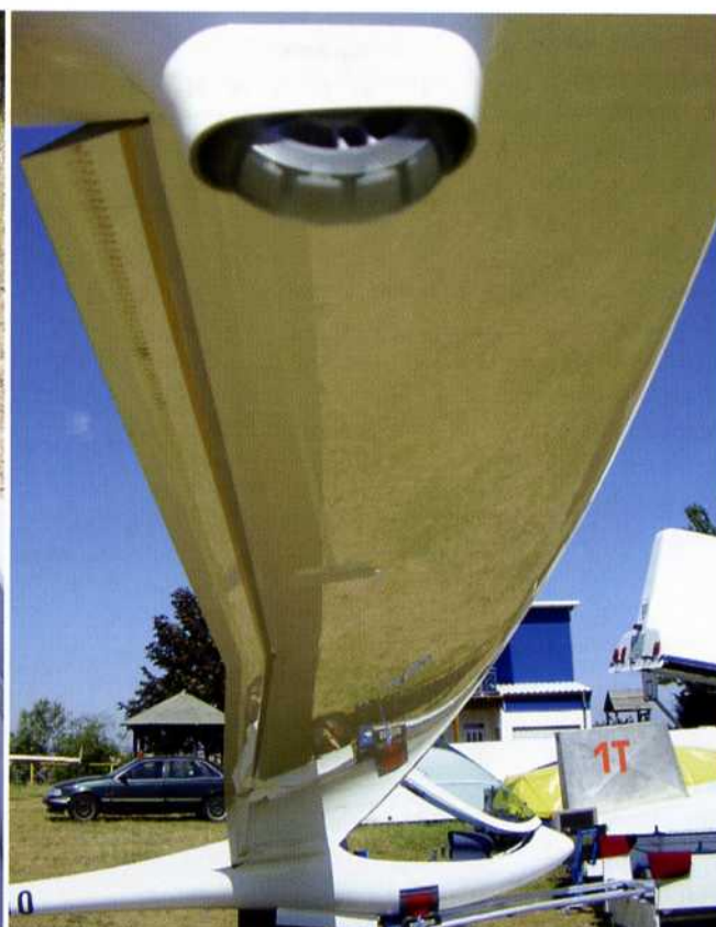
📍 Durch die nach hinten abknickende Endleiste wird die „superelliptische“ Flügelform erreicht

Konsole muss leicht in die gewünschte Richtung geschoben werden. Zum Fahrwerkseinfahren öffne ich den Schutzdeckel des Kipp-