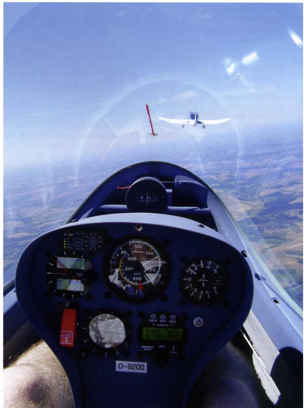
Die Sichtverhältnisse aus dem Cockpit sind hervorragend, die Schleppmaschine ist immer deutlich über dem Instrumentenpils sichtbar

Das Höhenleitwerk wird von oben auf die Seitenflosse aufgelegt und nach hinten geschoben, bis der auf der Oberseite im nicht verriegelten Zustand deutlich sichtbare rote Knopf des integrierten federbelasteten Sicherungsbolzens eingeschnappt ist und in der Kontur verschwindet. Anschluss des Höhenruders dabei automatisch über Wippe.