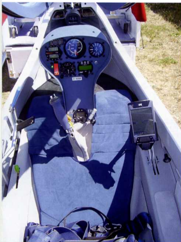
📍 Das Cockpit bietet viel Platz und Ellenbogenfreiheit

Konsole muss leicht in die gewünschte Richtung geschoben werden. Zum Fahrwerkseinfahren öffne ich den Schutzdeckel des Kipp-